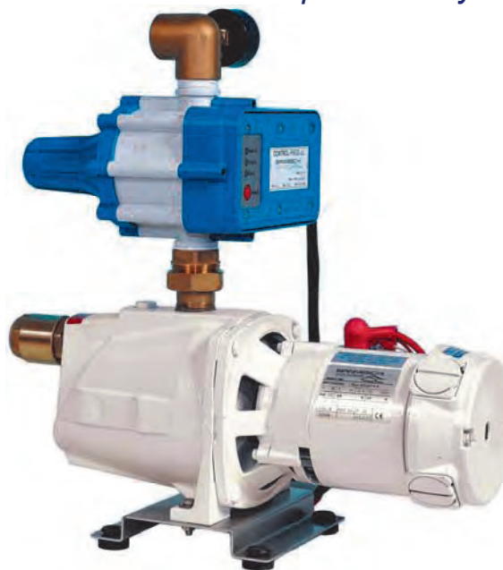
ECOJET B (bronze) C.E.